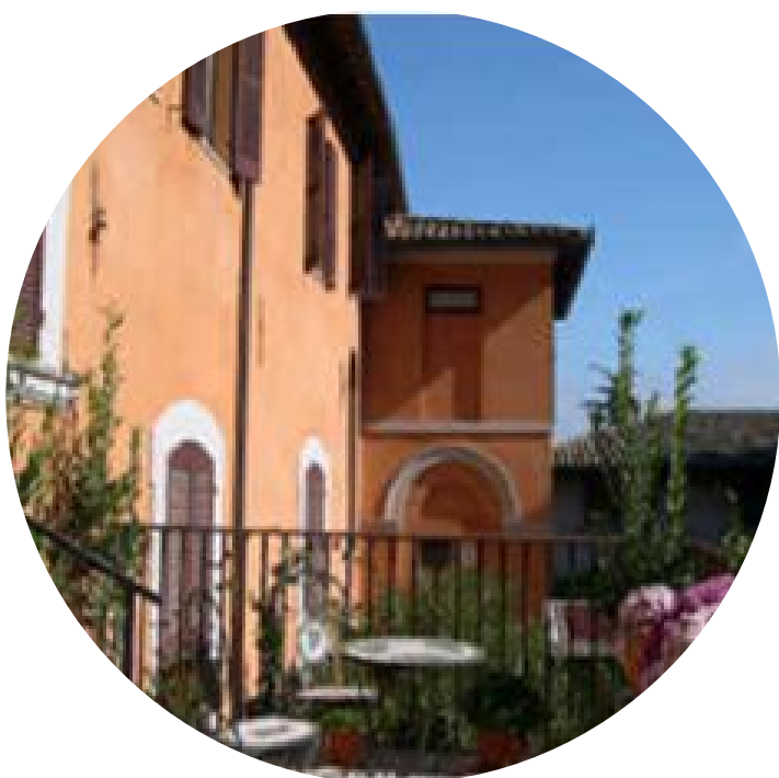
RESIDENZA PALAZZO FRANCISCI TODI (PG)

Trattamento Residenziale, Semiresidenziale Ambulatoriale