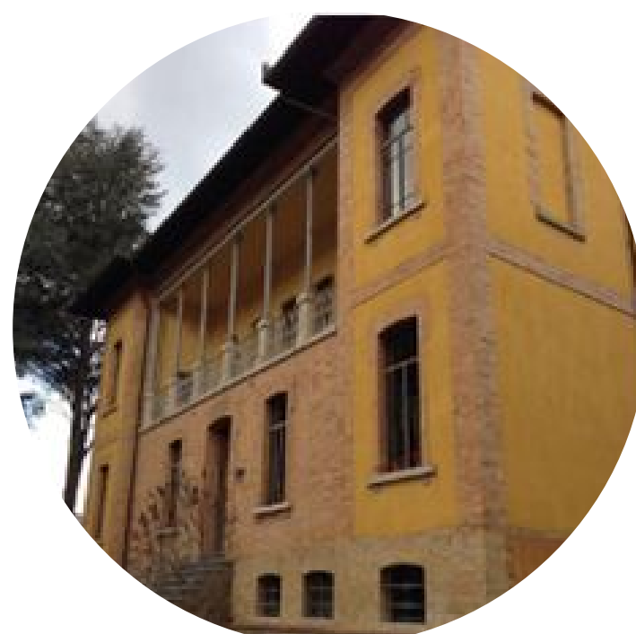
SERVIZIO AMBULATORIALE UMBERTIDE (PG)

Trattamento Residenziale, Semiresidenziale Ambulatoriale