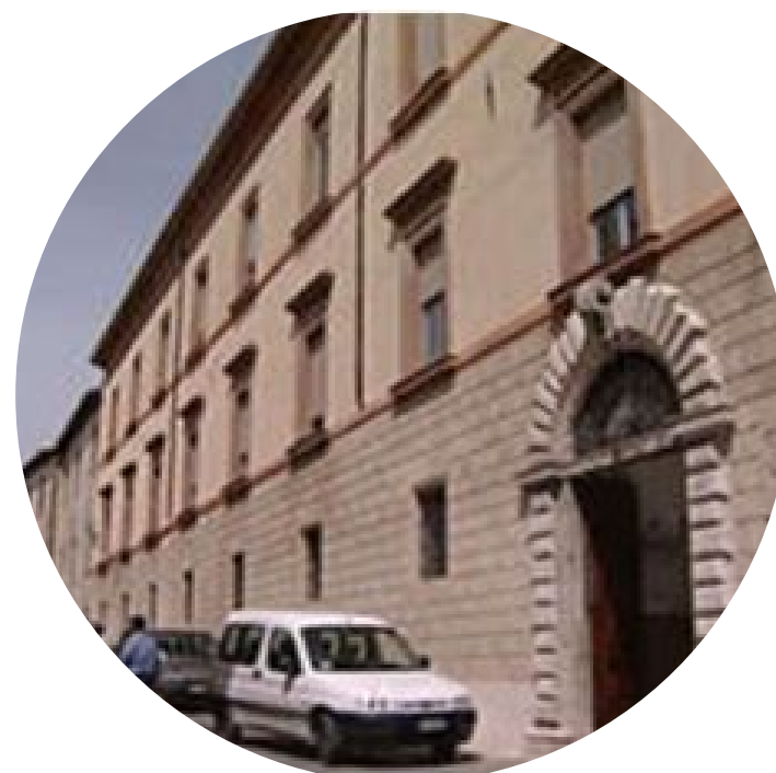
CENTRO DIURNO IL NIDO DELLE RONDINI TODI (PG)

Trattamento Residenziale, Semiresidenziale Ambulatoriale