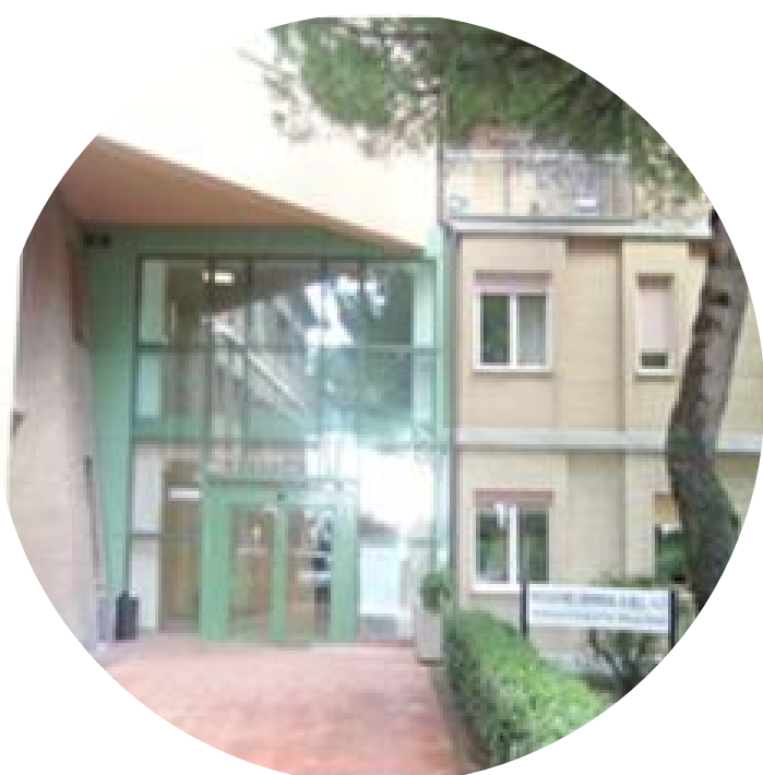
CENTRO DAI Centro per la Cura e la Diagnosi da Alimentazione Incontrollata e Obesità CITTA' DELLA PIEVE PG)

Trattamento Semiresidenziale e Ambulatoriale